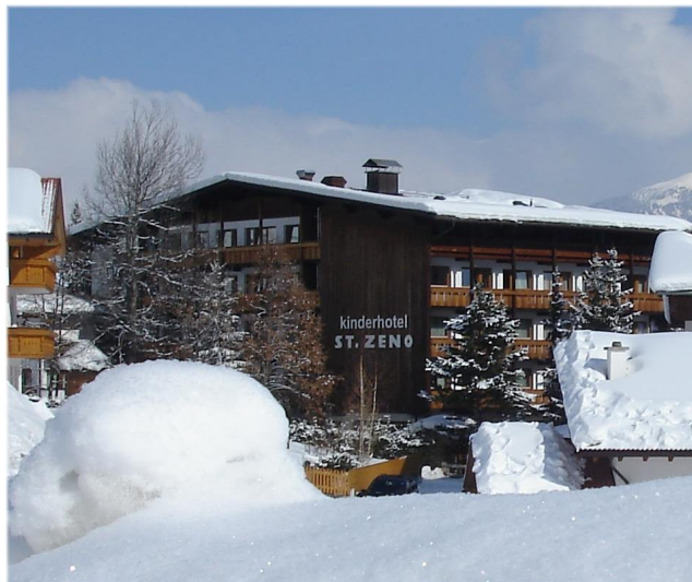
Familiy & Spa Kinderhotel St. Zeno.

(leanpress) SERFAUS/TIROL. Tief in den Tiroler Bergen hat sich ein neuer Hotelrend durchgesetzt: Statt „nur“ ein familiengerechtes Winterprogramm zu bieten, finden Familien im Family & Spa Kinderhotel St. Zeno ein ausgeklügeltes Urlaubskonzept für Körper, Geist und Seele.