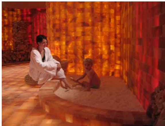
Salzgrotte im Familiy & Spa Kinderhotel St. Zeno.

Massagen, wird hier eine komplette Kind- und Babywellness-Welt angeboten. Der Große Spa-Bereich beinhaltet neben dem gehobenen Standardprogramm eine Salzgrotte, in der Haut und Atemwege in einem idealen Mikroklima „baden“ können. Das ist ideal für Eltern und Kinder. Darüber hinaus können Urlauber Geist und Körper einmal so richtig im Kristallsalz-Floatarium baumeln lassen. Der Körper treibt dabei auf einer hochprozentigen Wasser/Salzlösung, ähnlich wie im toten Meer. Der Aufbau des Floatariums ist dabei einer Energie spendenden Pyramide mit exakter Ausrichtung und Abmessungen nachempfunden.