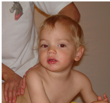
Baby Massage.